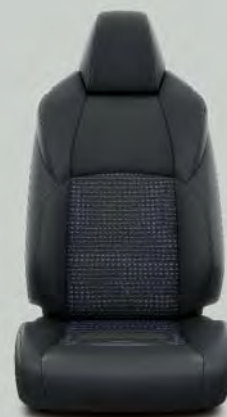
Leder/Alcantara bekleding, zwart met blauw stiksel (EC20) Standaard voor RAV4 Bi-Tone