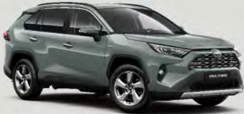
6X3 Urban Khaki 0