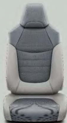
Lederen bekleding, lichtgrijs (LA10) Optioneel voor RAV4 Executive