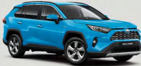
8W9 Cyan Splash Blue 5