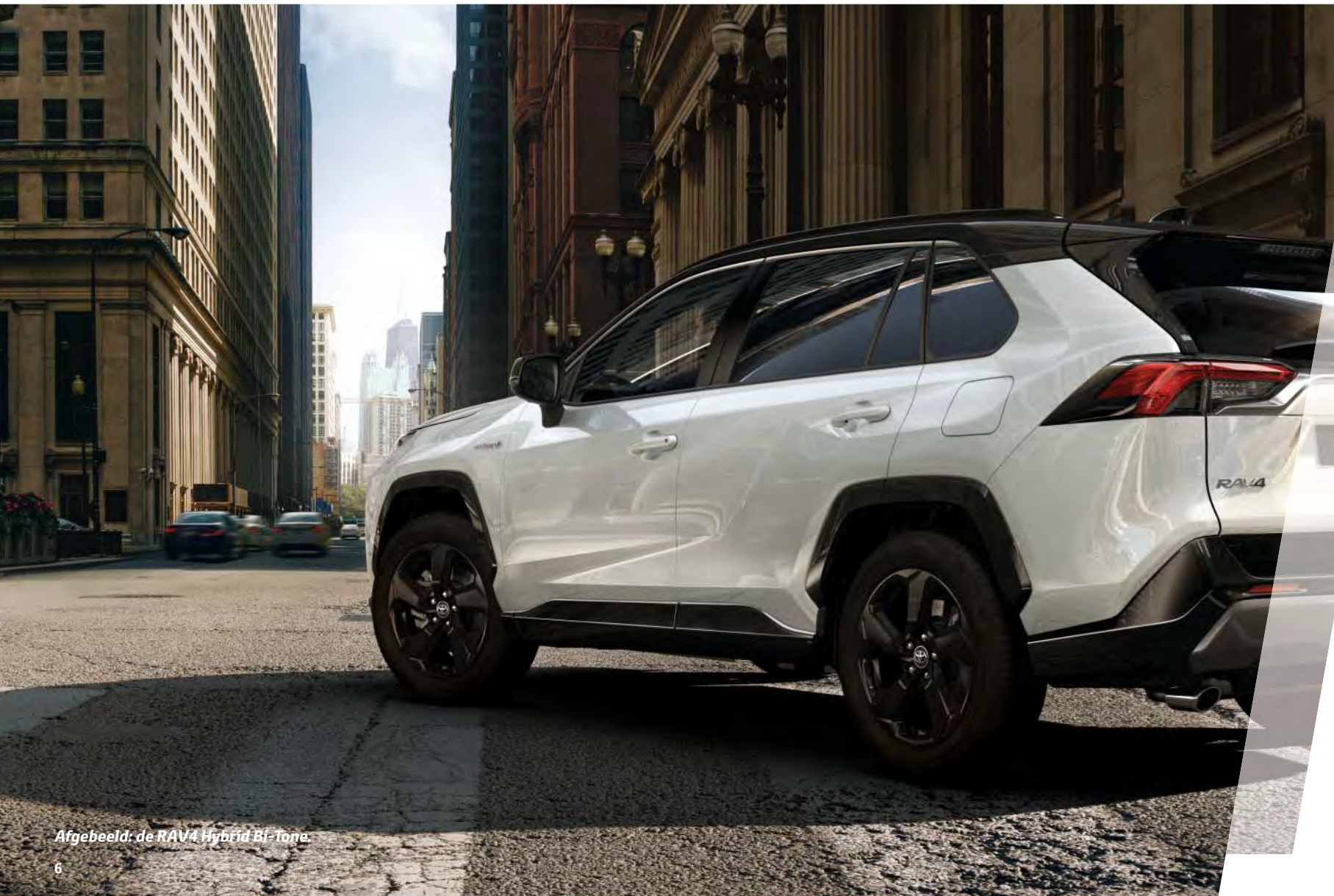
Afgebeeld: de RAV4 Hybrid Bi-Tone.