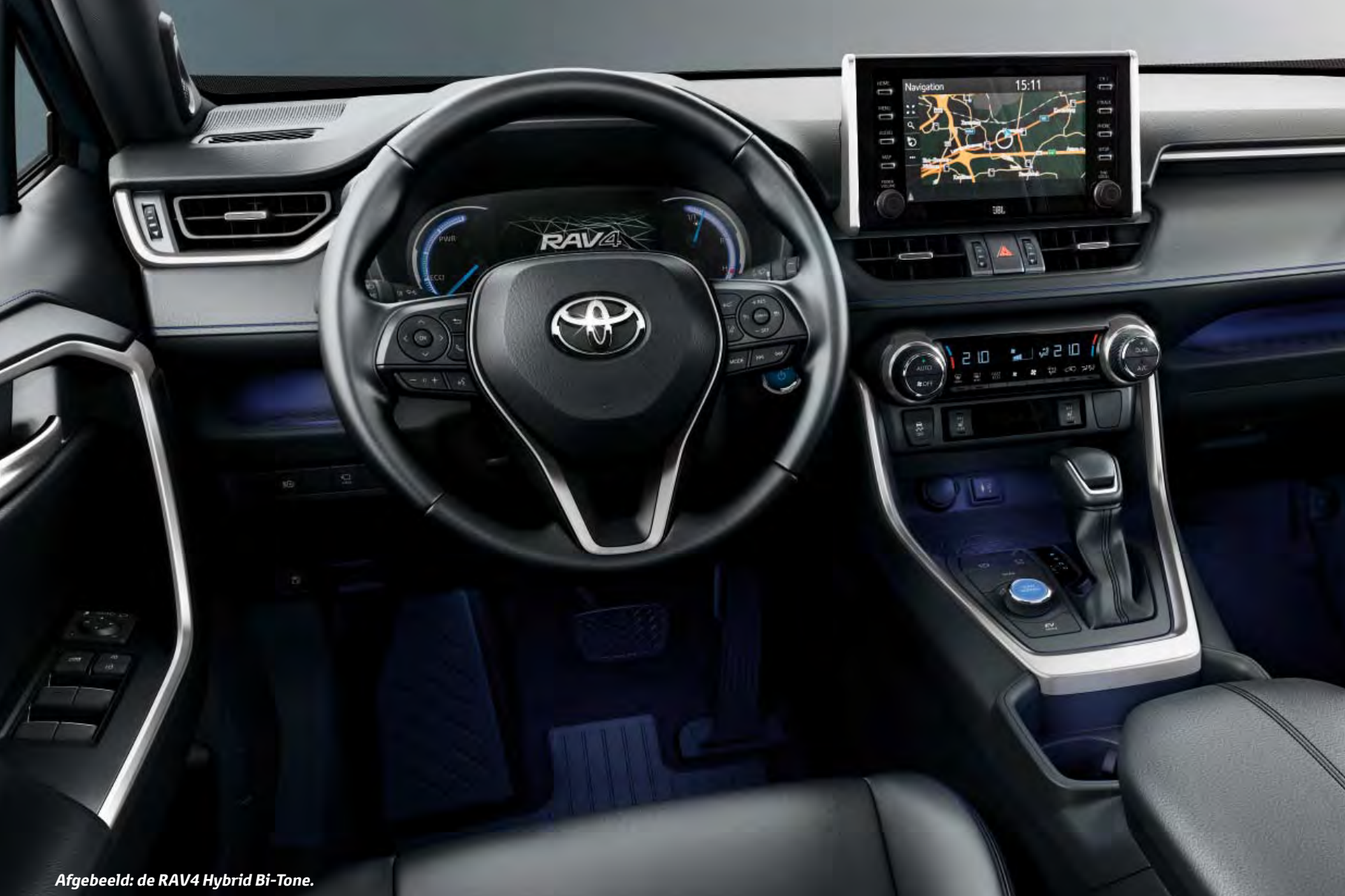
Afgebeeld: de RAV4 Hybrid Bi-Tone.