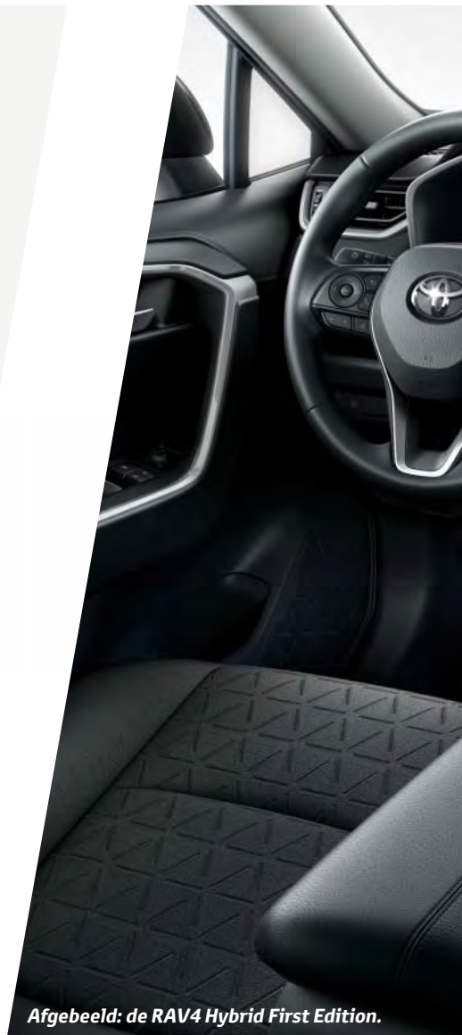
Afgebeeld: de RAV4 Hybrid First Edition.