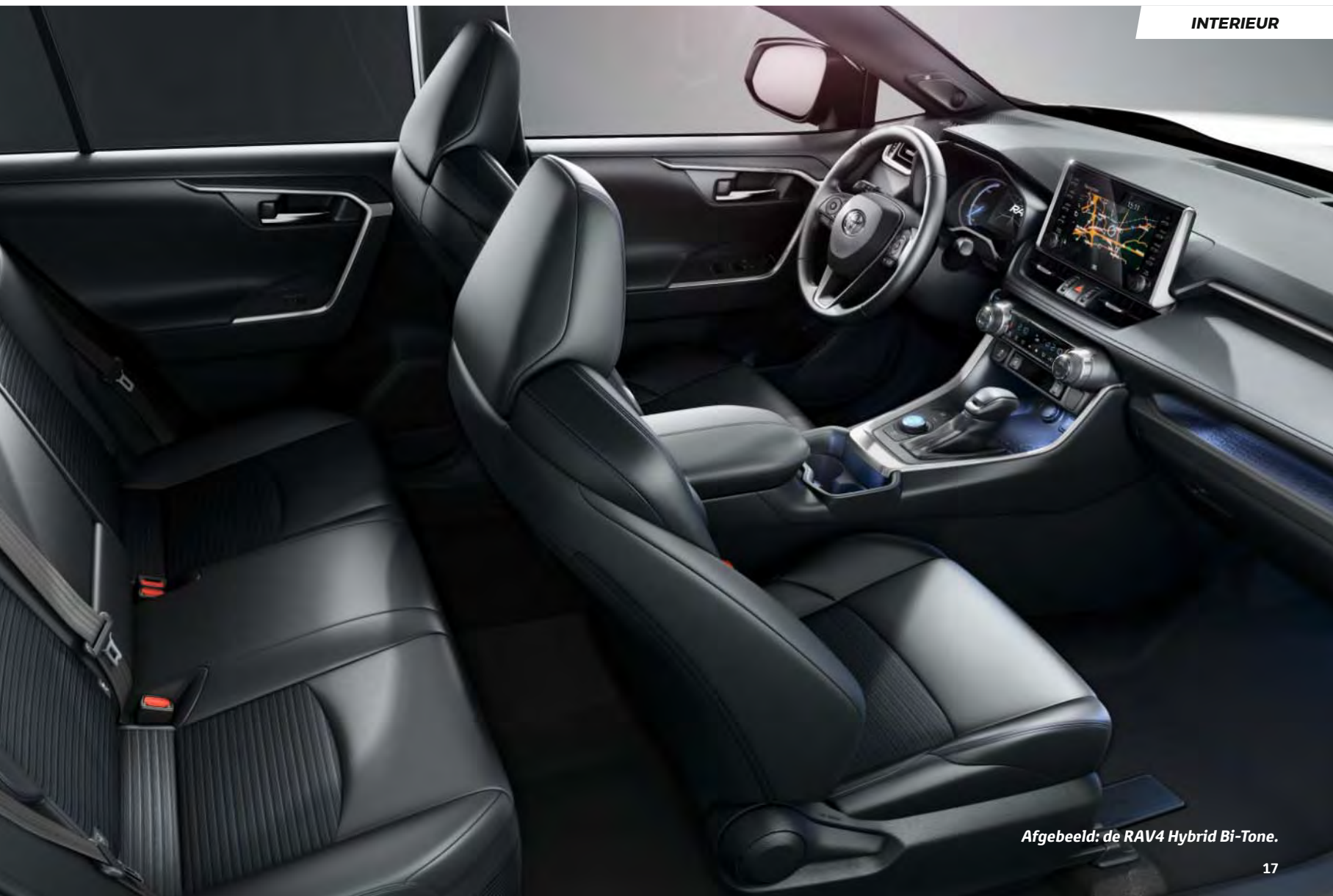
Afgebeeld: de RAV4 Hybrid Bi-Tone.