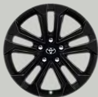
18" hoogglans zwart lichtmetalen velgen (5-dubbelspaaks)