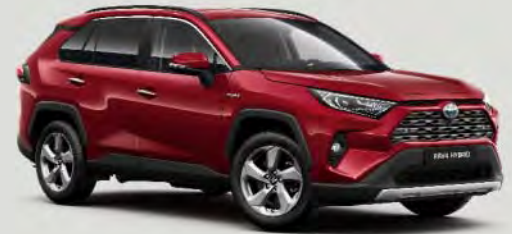
3T3 Tokyo Red*