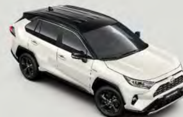
2QJ Pearl White* met dak** in Attitude Black §

Voor de RAV4 is een brede reeks van carrosseriekleuren beschikbaar, van Pure White tot het koele Midnight Blue. Kiest u de RAV4 Bi-Tone, dan kunt u kiezen voor een verrassend effect, door het in hoogglans zwart uitgevoerde dak te combineren met een van de vier contrasterende kleuren.