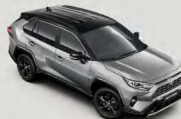
2QY Zircon Silver § met dak** in Attitude Black §