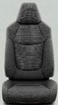
Stoffen bekleding, zwart (FB20) Standaard voor RAV4 Comfort