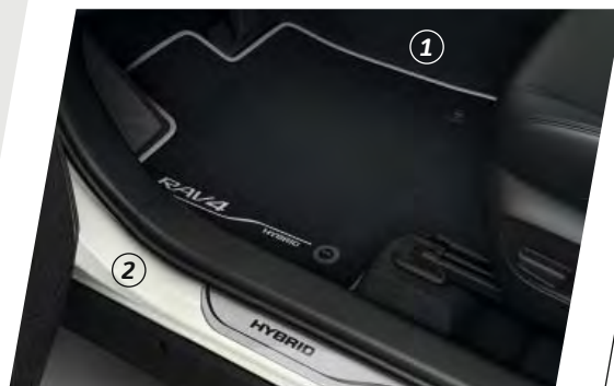
Aluminium dorpellijsten en stoffen vloermatten

De hoogwaardige Smart Key cover (3) is een chique detail dat uw Hybride compleet maakt.