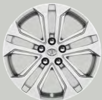
18" hoogglans zilver lichtmetalen velgen (5-dubbelspaaks)