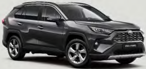
1G3 Ash Grey 5