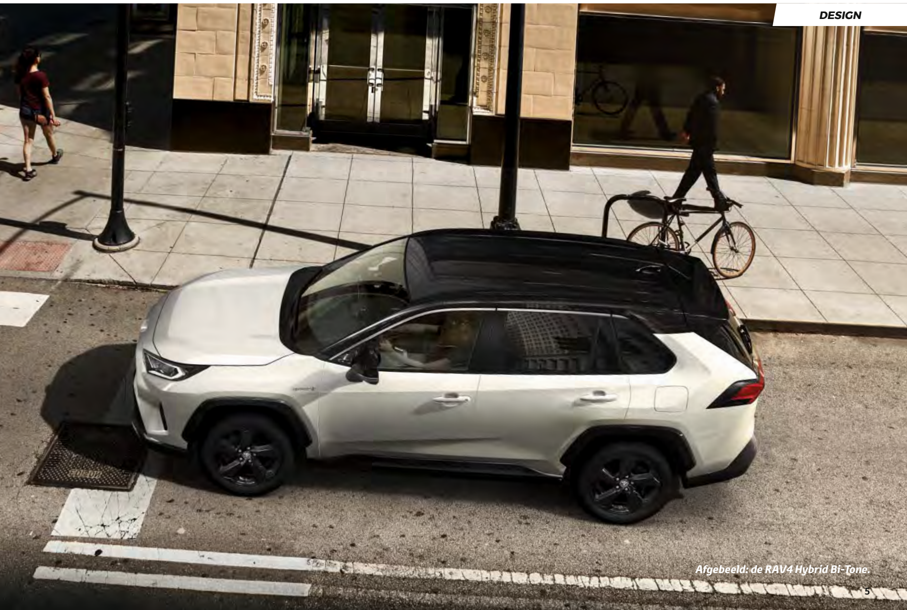
Afgebeeld: de RAV4 Hybrid Bi-Tone.