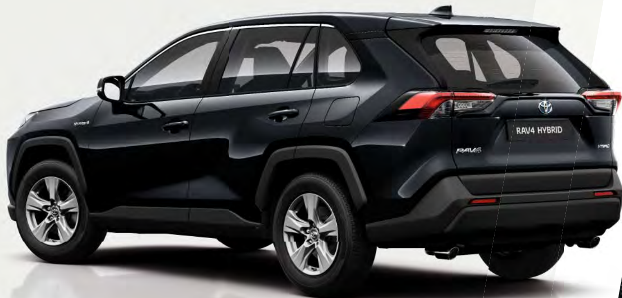
Afgebeeld: de RAV4 Hybrid Comfort.

De basisuitvoering van de RAV4, met een zeer complete standaarduitrusting. Voorzien van alles wat u nodig heeft, in een aantrekkelijk pakket zonder compromissen.