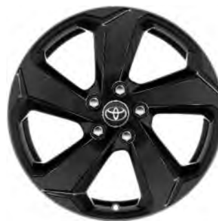
18" zwarte lichtmetalen velgen (5-spaaks)

Standaard voor RAV4 First Edition, Style en Hybrid Executive