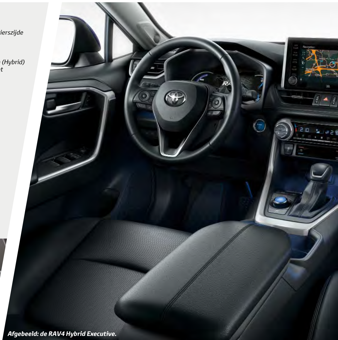
Afgebeeld: de RAV4 Hybrid Executive.