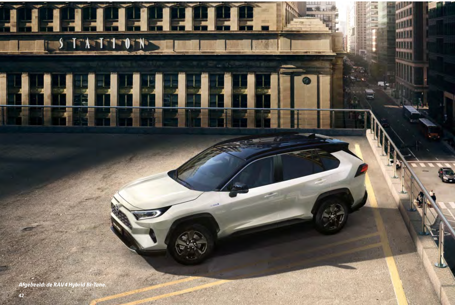
Afgebeeld: de RAV4 Hybrid Bi-Tone.