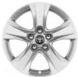
17" zilverkleurige lichtmetalen velgen (5-spaaks)

Standaard voor RAV4 Hybrid Comfort en Active