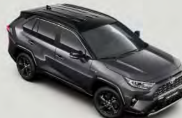
2QZ Ash Grey § met dak** in Attitude Black §