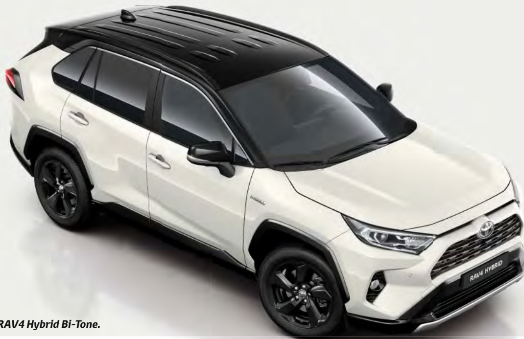
Afgebeeld: de RAV4 Hybrid Bi-Tone.

Voor liefhebbers die graag een goede indruk maken, is de Bi-Tone uitvoering een duidelijk statement. Tal van prachtige details geven deze uitvoering van de RAV4 een hippe, urban uitstraling.