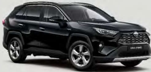
218 Attitude Black 5