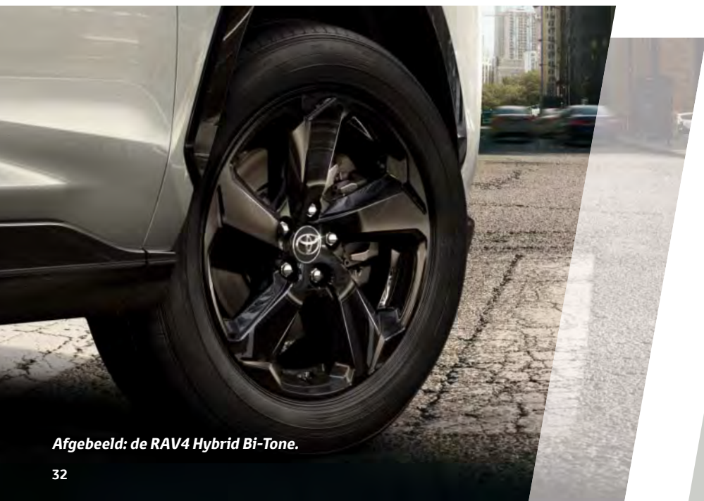
Afgebeeld: de RAV4 Hybrid Bi-Tone.

Maak uw keuze uit verschillende fraaie lichtmetalen velgen, van 17" tot en met 19" en ontworpen om perfect te passen bij uw RAV4.