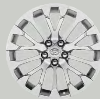
19" hoogglans zilver lichtmetalen velgen (15-spaaks)