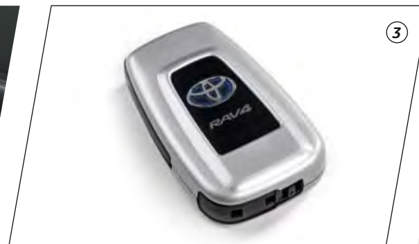
Hoogwaardige Smart Key cover