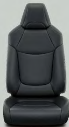
Kunstleder, zwart (EA20) Standaard voor RAV4 Style