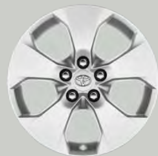
17" hoogglans zilver lichtmetalen velgen (5-spaaks) Optioneel voor alle uitvoeringen