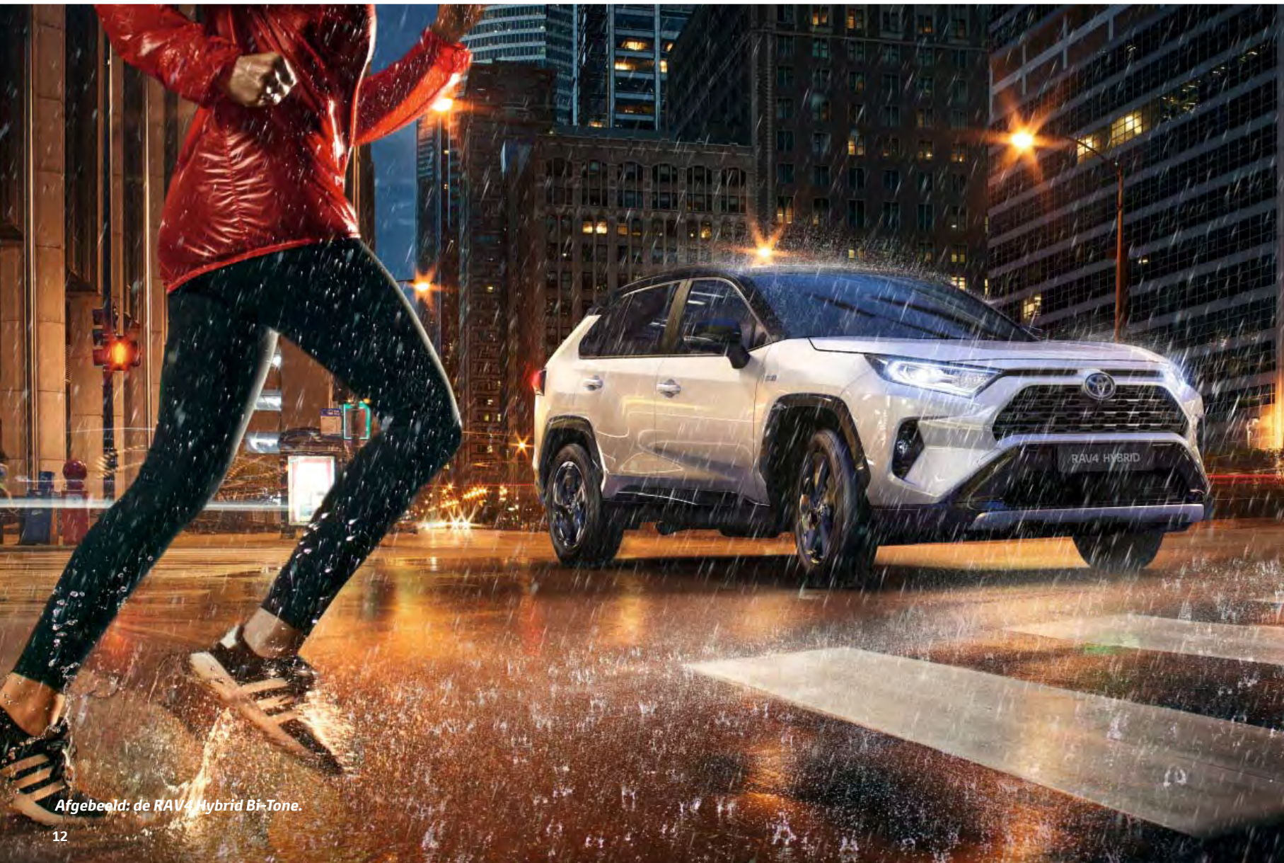
Afgebeeld: de RAV4 Hybrid Bi-Tone.