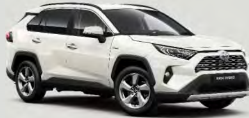
070 Pearl White*