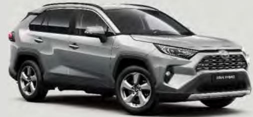
1D6 Zircon Silver 5