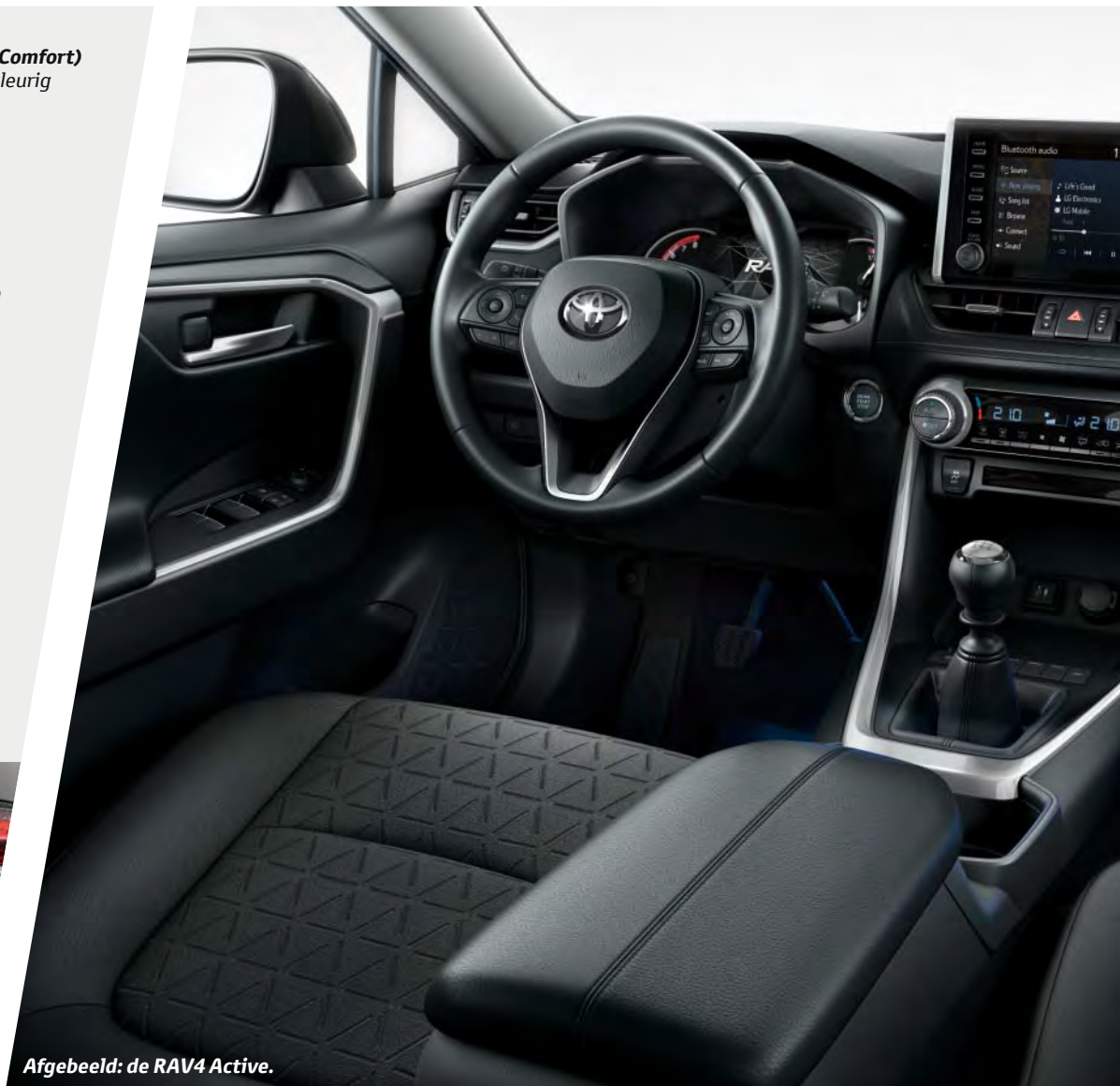
Afgebeeld: de RAV4 Active.