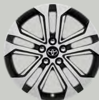
18" zwart gepolijst lichtmetalen velgen (5-dubbelspaaks)