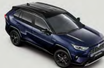
2RA Midnight Blue § met dak** in Attitude Black §

* Parelmoer lak. § Metallic lak. ° Signaallak.