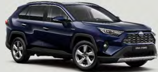
8X8 Midnight Blue 5