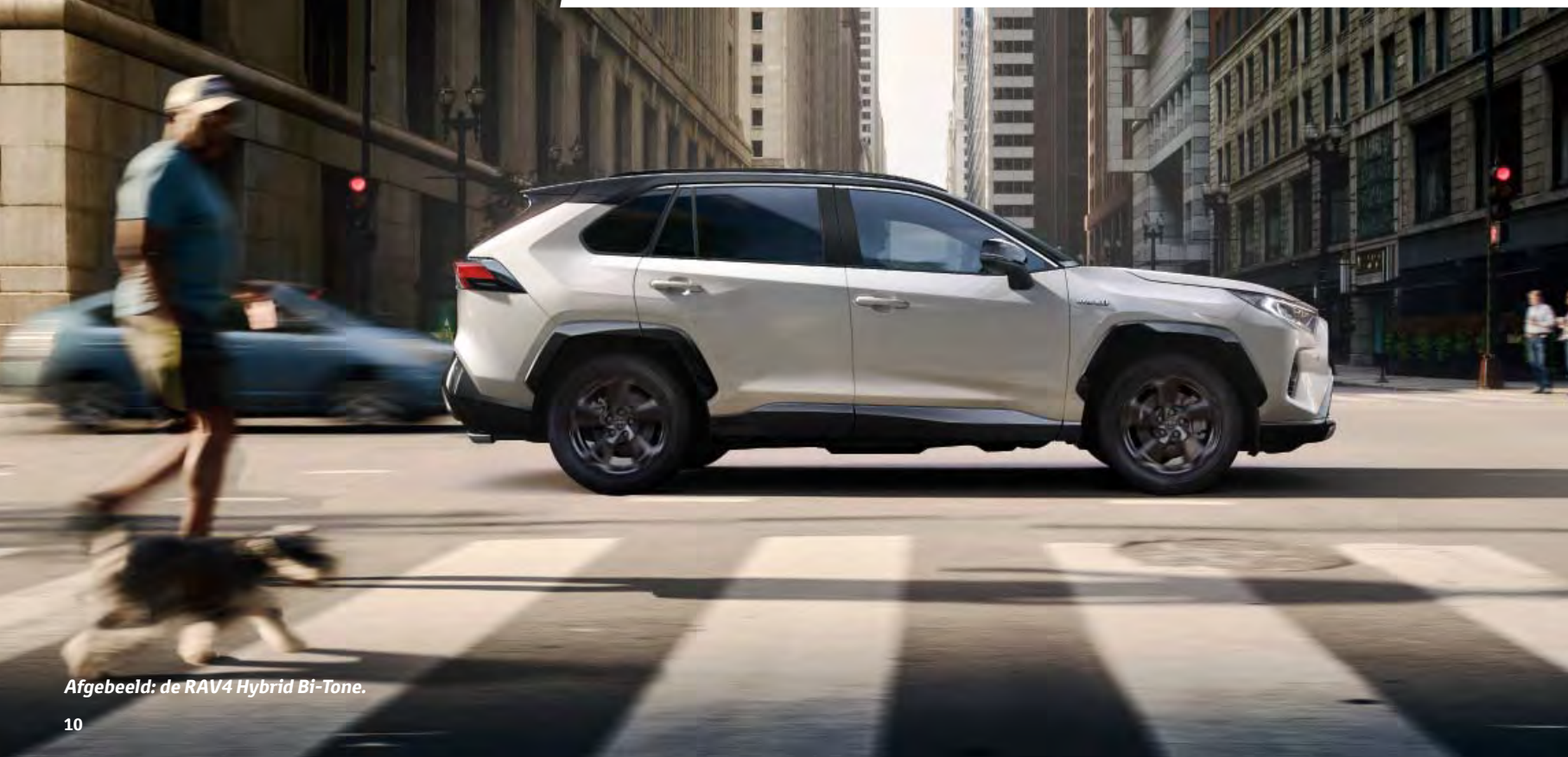
Afgebeeld: de RAV4 Hybrid Bi-Tone.