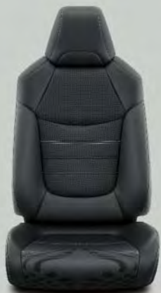
Lederen bekleding, zwart (LA20) Standaard voor RAV4 Executive