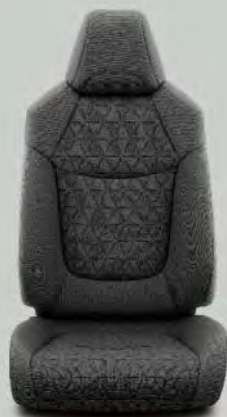
Luxe stoffen bekleding, zwart (FA20) Standaard voor RAV4 Active en First Edition