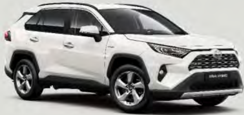
040 Pure White