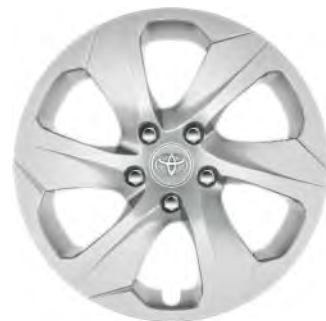
17" stalen velgen met zilverkleurige naafdoppen (6-spaaks) Standaard voor RAV4 benzine Comfort