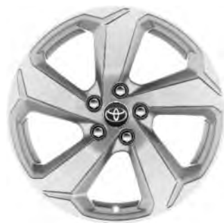
18" zilverkleurige lichtmetalen velgen (5-spaaks)

Standaard voor RAV4 Hybrid Comfort en Active