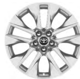
19" zilverkleurige lichtmetalen velgen (5-dubbelspaaks)