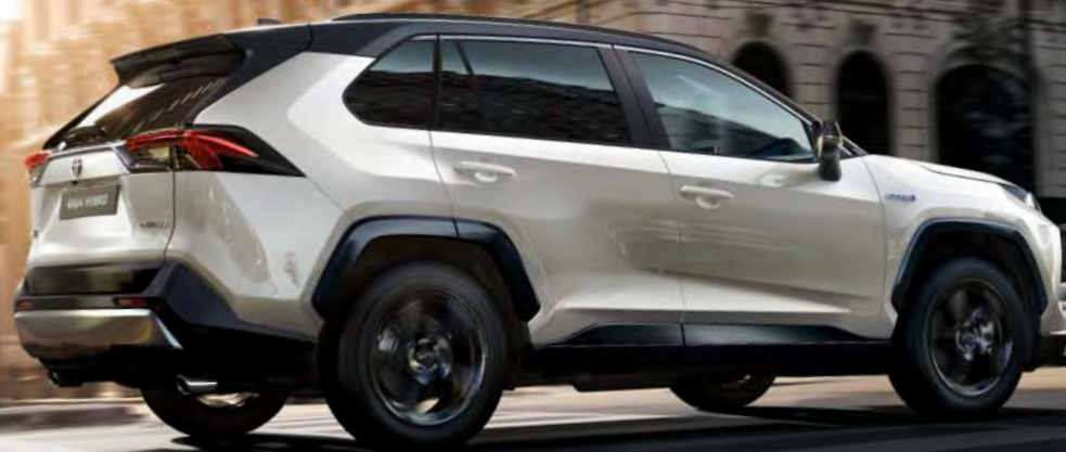
Afgebeeld: de RAV4 Hybrid Bi-Tone.