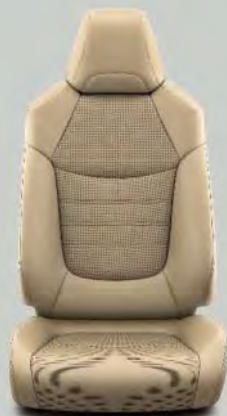
Lederen bekleding, beige (LA40) Optioneel voor RAV4 Executive