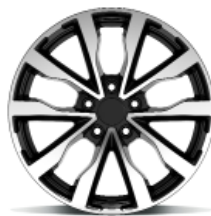
Arianna Zwart gepolijst

Voor € 690,- incl. montage # Uw voordeel € 1.460,-