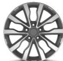
Arianna Titanium gepolijst