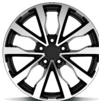
Arianna Zwart gepolijst

Voor € 490,- incl. montage # Uw voordeel € 1.455,-