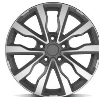
Arianna Titanium gepolijst

# Bij inname van fabrieks 16" lichtmetalen velgen, banden en bandenspanningssensoren