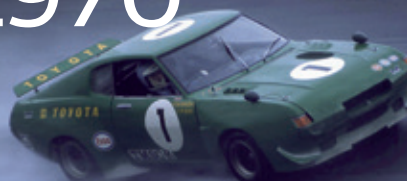
Celica Turbo / Fuji 1000 km