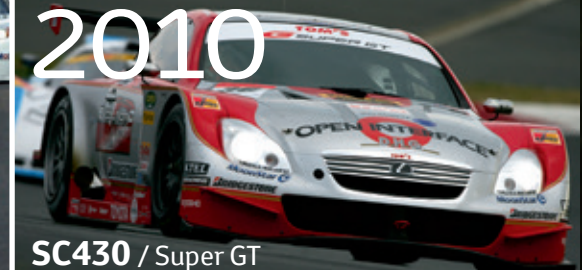
SC430 / Super GT