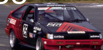
Corolla AE86 / Inter TEC