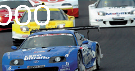
Supra 2000GT / JGTC