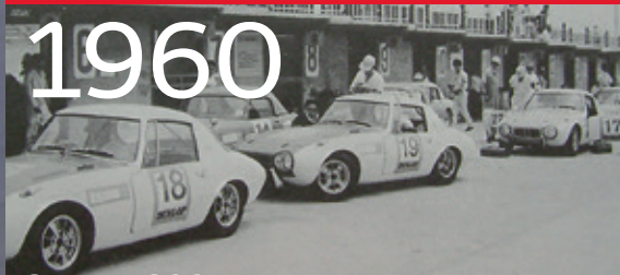
Sports 800 / Suzuka 500 km