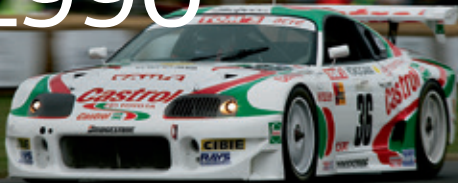
1997 JGTC Supra / Goodwood